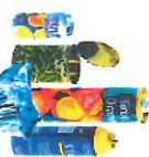
Emballages métalliques vides