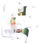
Bocaux et pots