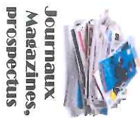
Journaux Magazines, prospectus