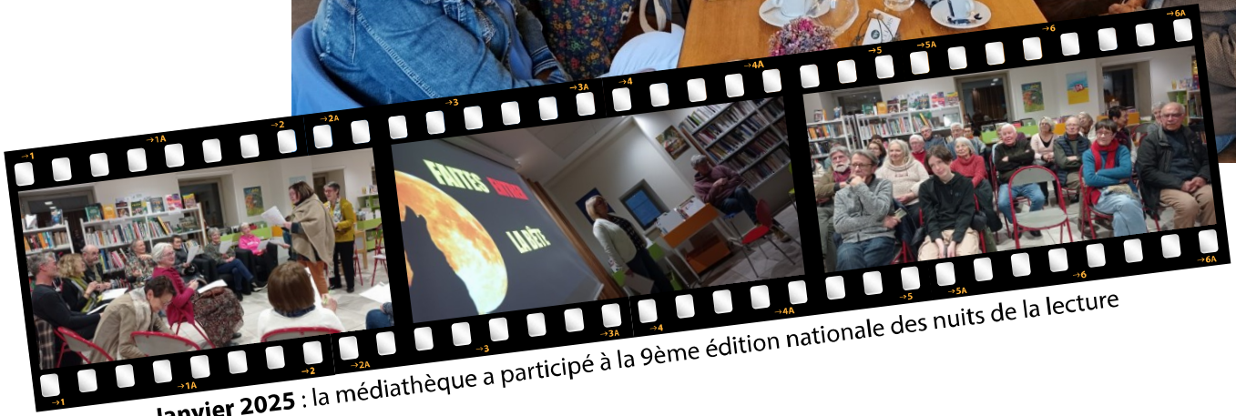
Janvier 2025 : la médiathèque a participé à la 9 ème édition nationale des nuits de la lecture