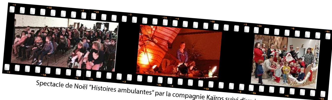
Spectacle de Noël "Histoires ambulantes" par la compagnie Kairos suivi d'un instant musical

De septembre à décembre 2025 : pèle-mèle de rencontre proposées par la médiathèque municipale pour conclure l'année 2025