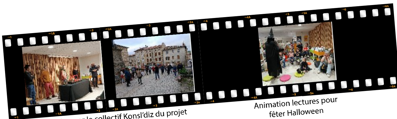
Présentation par le collectif Kons'l'diz du projet "On nait pas d'un pays..."