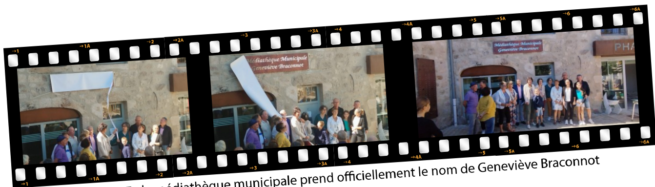
août 2025 : la médiathèque municipale prend officiellement le nom de Geneviève Braconnot