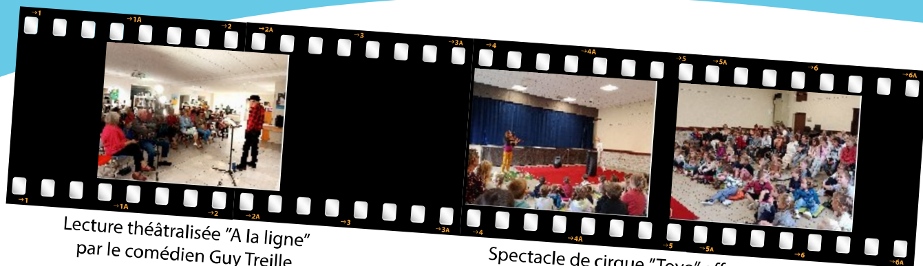
Lecture théâtralisée "A la ligne" par le comédien Guy Treille