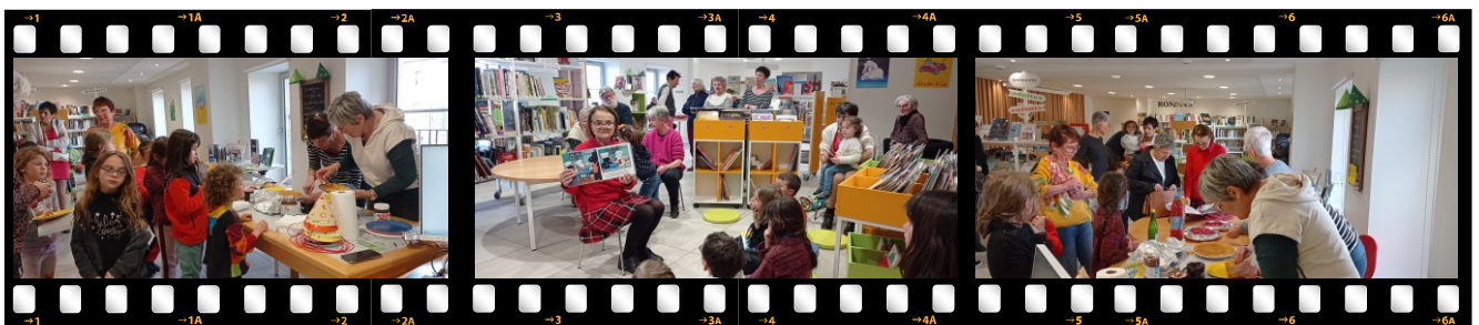
Février 2025 : crêpes, confitures et lectures ont ravi petits et grands lors du mardi-gras