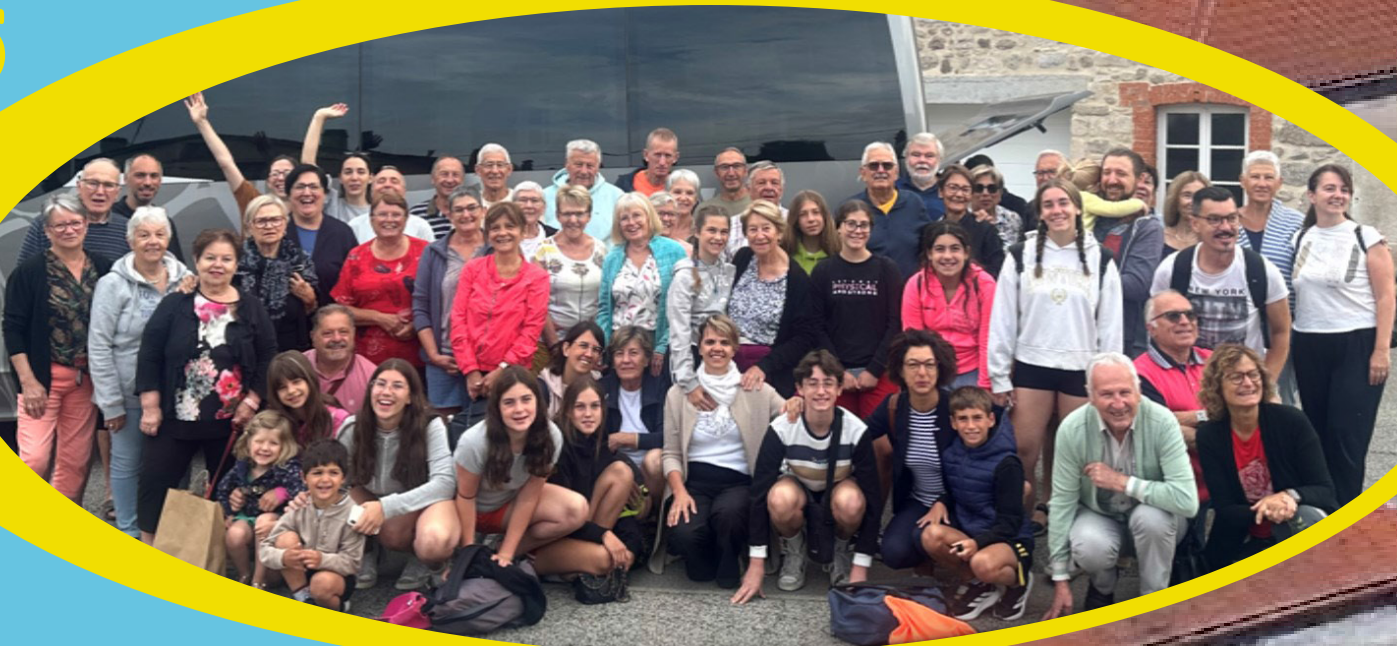
Réception de nos amis Italiens