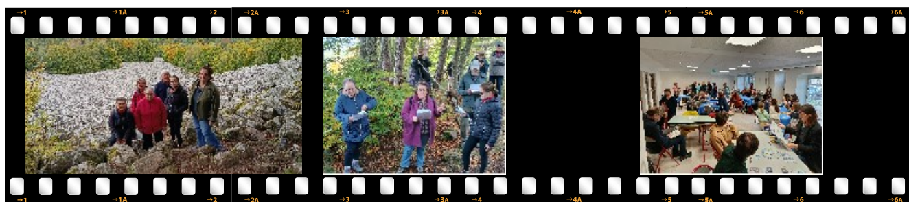
Rando-lecture sur le thème des volcans