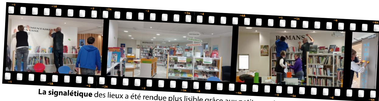
La signalétique des lieux a été rendue plus lisible grâce aux petites mains actives des bénévoles